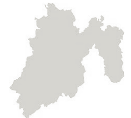
Estado de México

Busca dotar a madres, padres y cuidadores de los recursos y habilidades personales y familiares para el crecimiento integral de niñas, niños y adolescentes